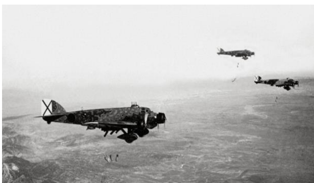
Savoia Marcheti SM 81