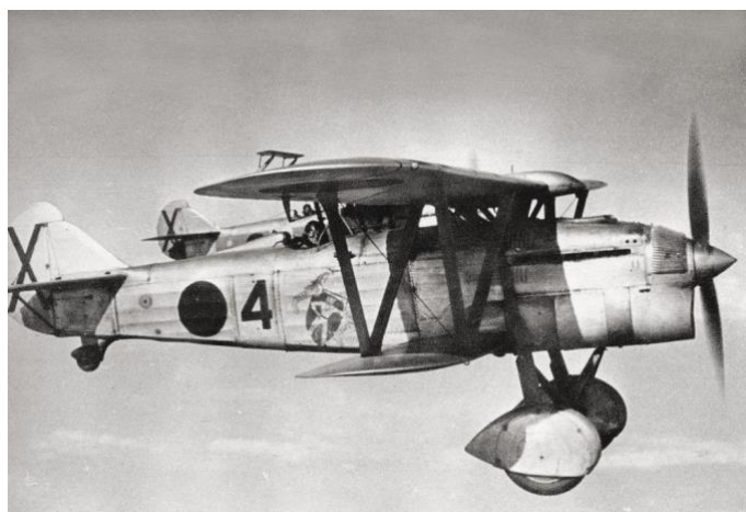
FIAT CR32 Baleari

Bonbardaketa burutzeko, Durangotik Elorriona eta ondoren Kanpazarrera doan errepidea hartu zuten ardatz gisa, eta baita Berrio Otxoa kalea ere. Hau da, hegazkinek mendebaldetik ekialdera zihoan bidea egin zuten.