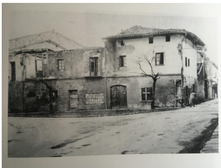
LA PAZ fonda

Bonbek, beste batzuen artean, Santa Anako nobiziatua, Greavesen etxea, La Paz ostatua eta Berrio Otxoa kaleko beste leku batzuk harrapatu zituzten, eta baita Kurutzia gako Aldatsekua jauregiaren ingurunea eta Ondozorrotz baserrietxea ere.